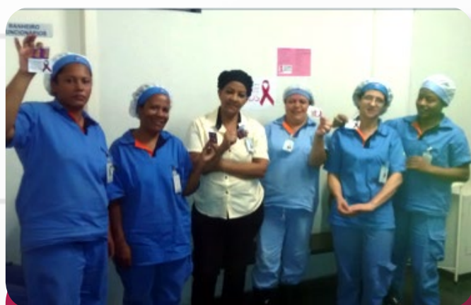
Campanha Prevenção contra a AIDS da Funcional Facilities, unidade Hospital Belo Horizonte.