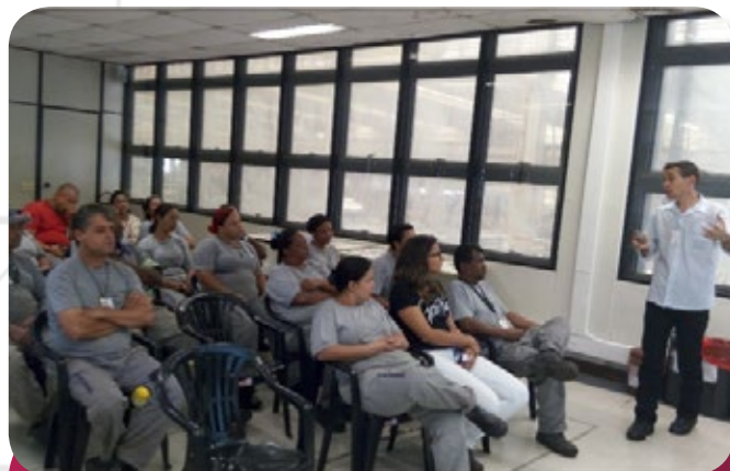
Semana de Saúde e Segurança realizada pela equipe da Cipa da Funcional Facilities na unidade Sae Towers